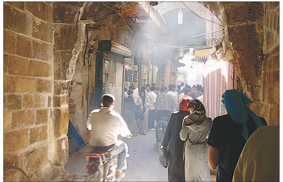
Gwarne ulice syryjskich miast wypełnia echo dyskusji o pobliskim konflikcie.

Na ulicach i placach ludzie gromadzą się wokół głośników, z których słychać płomienne przemowy przywódcy Hezbollahu. Mówiąc krótko, duch ulicy przepełniony jest