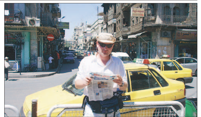
Nasz Czytelnik zabrał ze sobą świeże wydanie „Dziennika Bałtyckiego”. Podczas dalekiej podróży przypomina mu Pomorze.

wiarą w zwycięstwo. Widać duże napięcie i zainteresowanie wydarzeniami z terenu, odległego nieraz tylko o kilkadziesiąt kilometrów dalej. Jednak nie spotykamy się z wrogością, wręcz przeciwnie – prawie każdy chce z nami porozmawiać, zaczepić i wypić z nami herbatę. Widać wyraźnie, że nie dotarła tutaj jeszcze potęga turystyki. Paradoksalnie niemal każdy zapewnia nas, że w całej Syrii jest na razie bezpiecznie i nic nam nie grozi jako turystom. Pełni