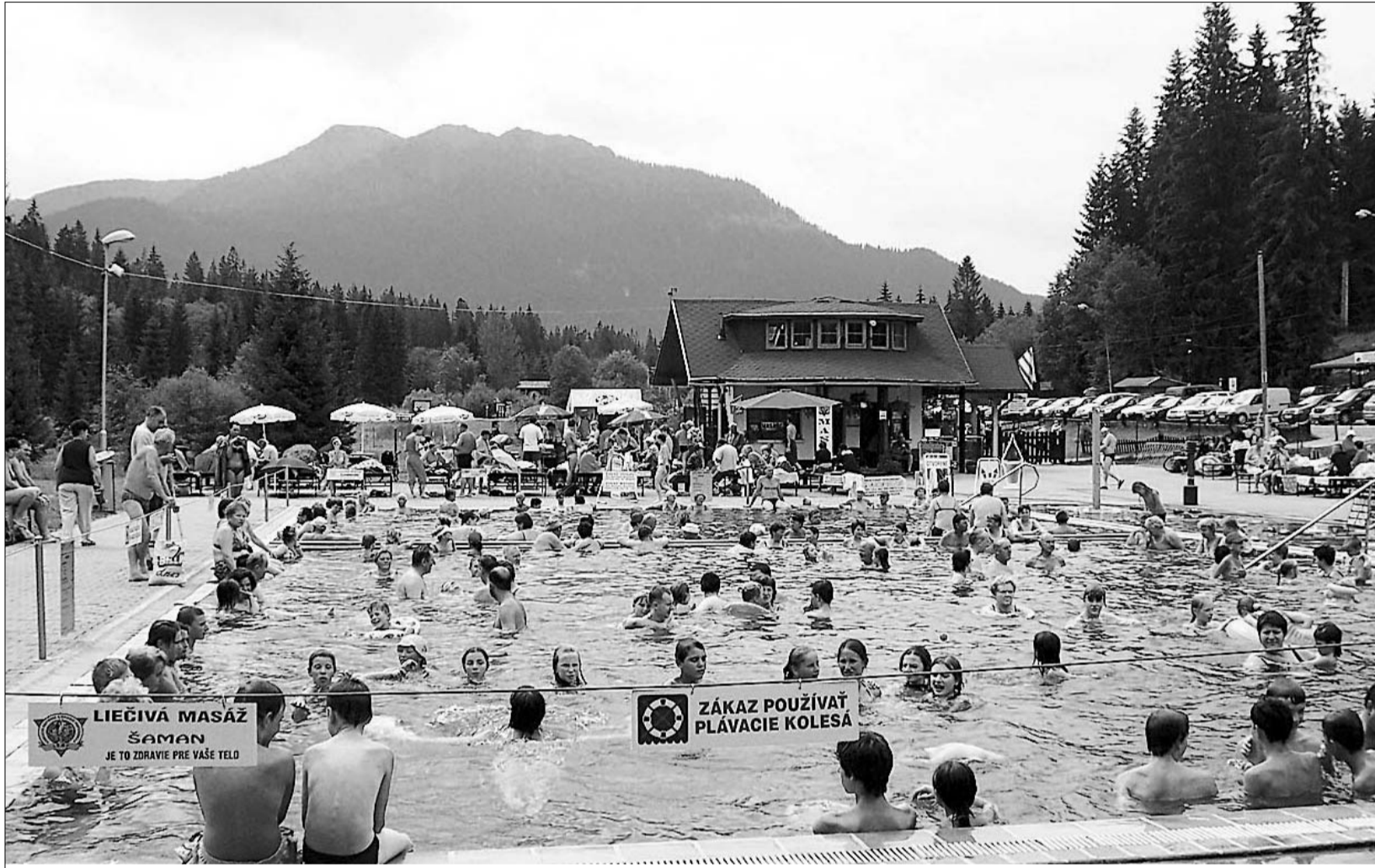
Baseny wypełnione są wysokozmineralizowaną wodą, która zawiera związki wielu życiodajnych pierwiastków, w tym znaczne ilości magnezu.

Rodzinny wyjazd do naszych południowych sąsiadów – Słowacji – można z powodzeniem nazwać wyprawą po zdrowie. Ogromna ilość wód mineralnych i naturalnych kąpielisk czynią ten kraj rajem dla żądnych kąpiele i zabaw w wodzie miłośników leniuchowania.